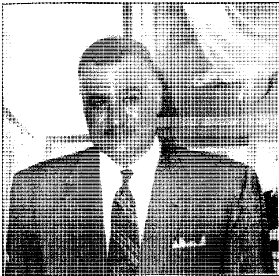
جمال عبد الناصر من الثورة إلى السلطة